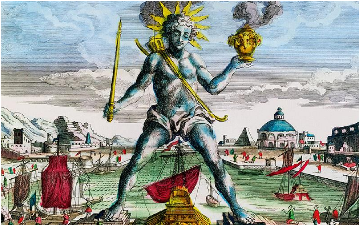
32-метровая статуя бога Гелиоса

Древнегреческая культура оказала огромное влияние на развитие европейской цивилизации. Достижения греческого искусства частично легли в основу эстетических представлений последующих эпох.